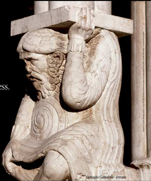
Dettaglio Cattedrale - Ferrara