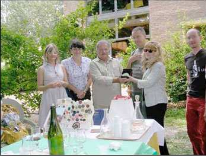
Premio alla vignetta

Per i giornalisti e comunicatori ASA stata essenziale per la copertura di alcune lacune nella storia dei giardini e dei frutteti vedersi davanti un vero " Brolo" . In Google trovate " Un brolo nuovo e antico : La delizia del Verginese oggi. Il termine brolo , compare proprio nella variante... paesaggistica del giardino posto a sud-est del Castello del Verginese ..." . Vi rimando per ragioni di tempo e spazio al PDF del sito .