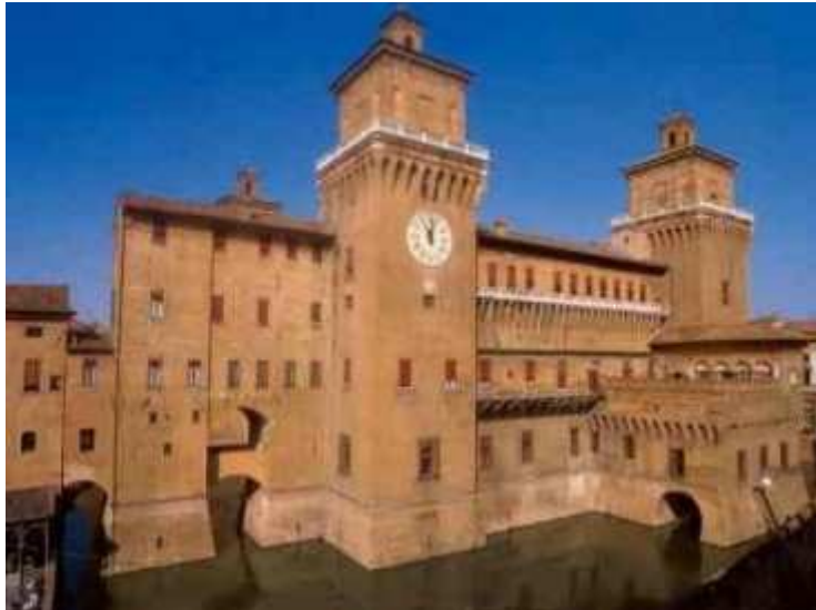
Ferrara, il Castello Estense