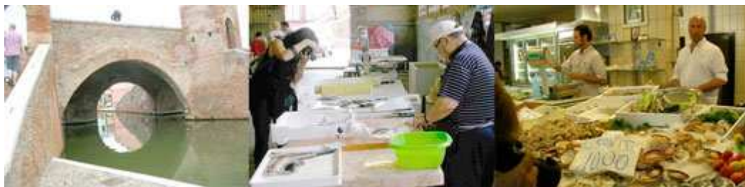
Foto 1: Baricentro di Treponti a Comacchio

occasioni. Quindi acquisto di rara latta da 900 g di Sarde Salate, brand Talatta, provenienti dall' antica amica ed amante del mare Sciacca, a 1000 km, di genuina memoria della mia adolescenza.