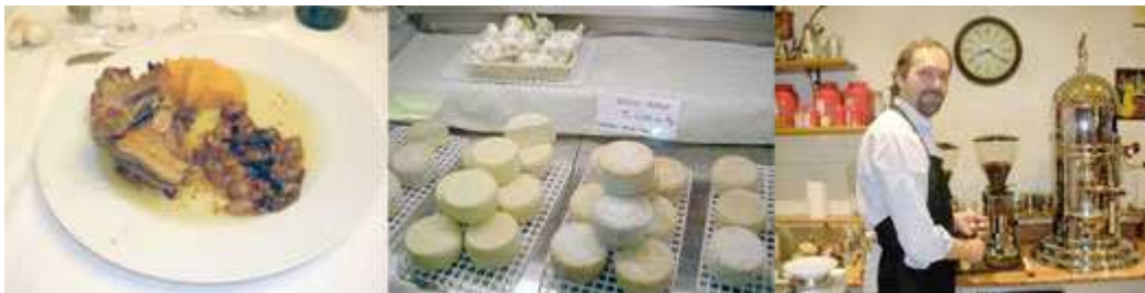
Foto1: Le anatre decoupees et roies Foto2: Formaggi all'aglio di Voghiera Foto 3: Caffè di primo novecento

Vini, riso con e anatre... e le attrezzature per il benessere con i prodotti tipici locali... alla villa di Quartesana. La villa isolata nel bel parco, appena fuori Ferrara - adibita Centro di Benessere - ha dato occasione di presentazione dell' artista con un intimo rapporto con il vetro: non manca il legame con la Gastronomia e una Ricerca di alleanze per l' affermazione di un rapporto personale tra Arte e turismo, Territorio e piano di promozione, barriere e stimoli politici - sensibilità alle iniziative di richiamo, tutti temi trattati prima con il presidente dell' associazione albergatori e confrontati con il ruolo di ASA sostenuto da Mioni.