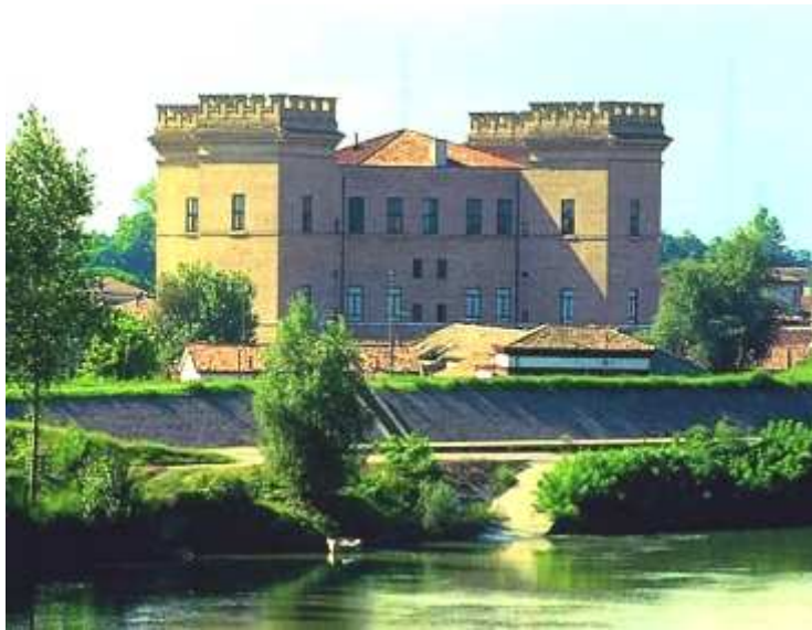
Castello Estense di Mesola

Un'altra interessante tappa è stata quella relativa alla visita del Castello di Mesola che dista solo pochi chilometri dall'Abbazia di Pomposa che con il suo campanile svettante, è ben visibile anche da notevole distanza.