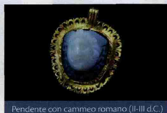
Pendente con cammeo romano (II-III d.C.)

Un'ampia panoramica su tutto il meglio del settore grazie alla partecipazione di 90 espositori di prestigio internazionale.