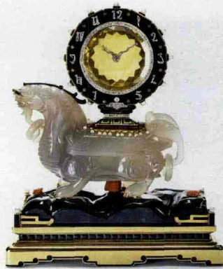
Chimera Mystery Clock di Cartier (1926)

Lacca, giada e smalti: spesso la maison francese si è ispirata all'Oriente e ora la Città proibita ospita i suoi tesori.