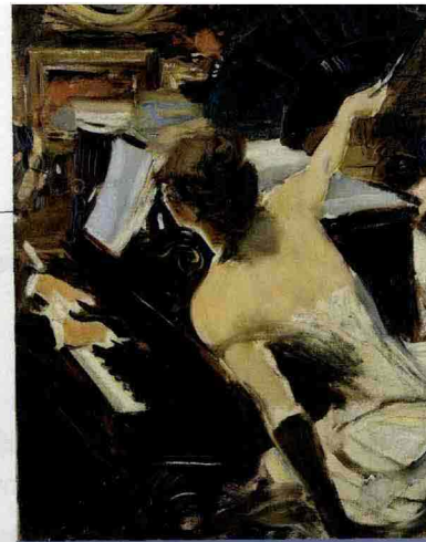
Giovanni Boldini, La cantante mondana (1884)

La mostra nasce dalla collaborazione delle tre più importanti collezioni pubbliche delle sue opere. Oltre un centinaio di dipinti e 60 disegni dell'artista russo dal 1902 al 1942.