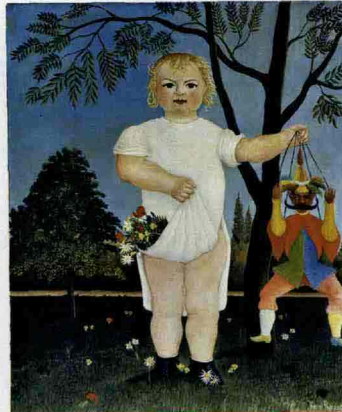
Henri Rousseau, Per festeggiare il bambino (1903)

Capolavori della modernità Mart, Rovereto. Fino al 10 gennaio 2010