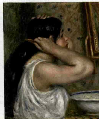
Pierre-Auguste Renoir, La toilette

In collaborazione con Pierre Bergé, la casa d'aste Christie's presenta la seconda parte della collezione di Yves Saint Laurent e del suo socio. I proventi andranno in beneficenza per la lotta contro l'Aids.