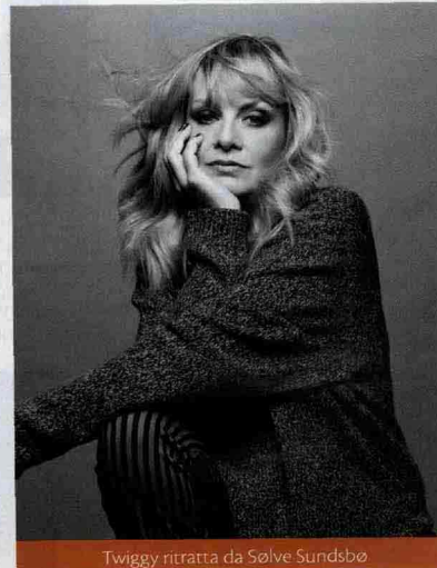
Twiggy ritratta da Solve Sundsbø

Il primo periodo francese (1871-1886), quando da pittore di Parigi diventa ritrattista del bel mondo.