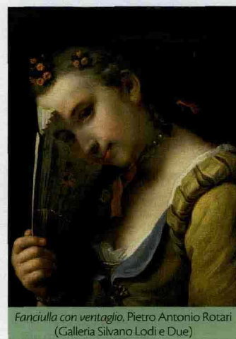
Fanciulla con ventaglio, Pietro Antonio Rotari (Galleria Silvano Lodi e Due)

Un'antologica senza precedenti in Italia, con oltre 160 opere in mostra e una ricca sezione fotografica per approfondire il contesto biografico e storico del suo lavoro.