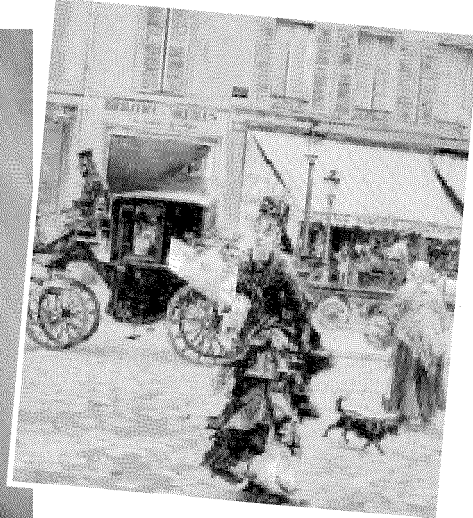
«Ritratto di Cléo de Mérode» (1901) e, in alto, «Attraversando la strada» (1873-'75). Nella pagina accanto, «Ritratto di Madame Charles Max» (1896) e ritratto di Giuseppe Verdi (1886). A Ferrara-Palazzo dei Diamanti, fino al 10 gennaio. Aperta tutti i giorni ore 9-19