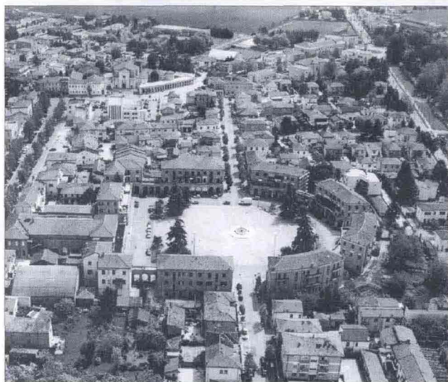
VEDUTA AEREA DI TRESIGALLO