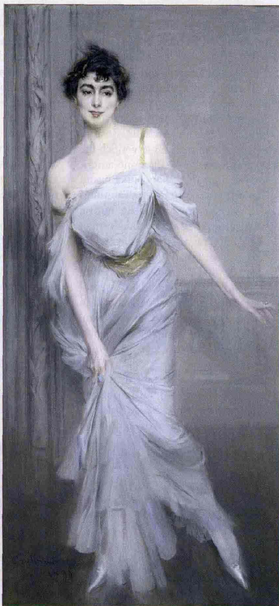
Giovanni Boldini, Ritratto di Madame Charles Max, 1896 , olio su tela, cm 205x100, Parigi, Musée d'Orsay, Parigi