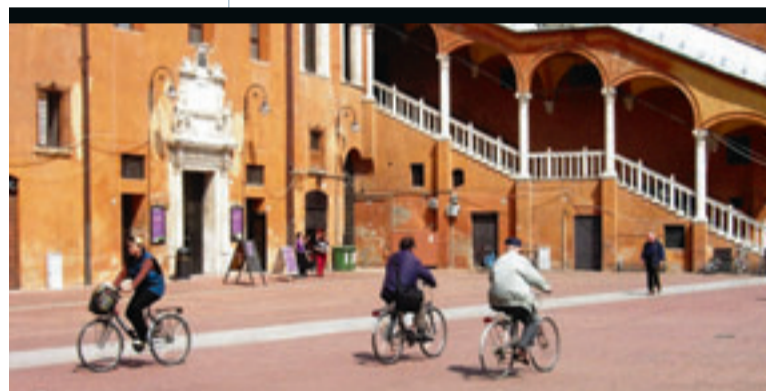
Ook op de Piazza Municipale zie je veel fietsers. De Ferrarees zou gemiddeld 2,8 fietsen bezitten.

die wandelaars, joggers en fietsers uitnodigt om te vertoeven in het groen. Je kan zowel op de muren als aan de buitenkant ervan ongestoord rondjes draaien. Op de fiets geraak je ook vlot van de steegjes van de middeleeuwse stad naar de royale straten van de 15de-eeuwse wijk. Ferrara werkt sinds enige jaren krachtig aan zijn imago als Città della bicicletta, de stad van de fiets. Zowel voor de fietser in het woon-werkverkeer als in de vrije tijd werd fors geïnvesteerd. Vandaag zou de Ferrarees gemiddeld 2,8 fietsen bezitten. Vanuit de stadskern vertrekken vele fietsroutes, waarvan er een aansluit op de Destra Po. Zo heet het fietspad op de rechteroever van de rivier dat de provinciegrens volgt tot helemaal aan de Adriatische Zee. En intussen zucht een vrouwelijke politieagent: «Ze gaan in de verboden richting, fietsen op het trottoir, negeren fluitend het rode verkeerslicht, vervoeren een vriendje dat achterop rechtstaat... Hoe krijg ik die ooit in het geïd?»