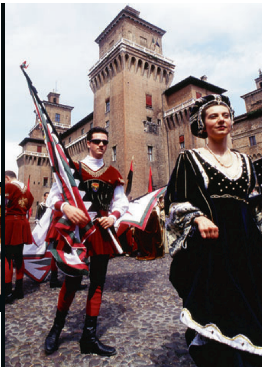
Tijdens de Palio schrijden duizenden piekfijn uitgedoste figuranten tussen waiende velds naar het Castello Estense en brengen hulde aan hertog Borso.

F errara zit met zijn 130.000 inwoners niet in de kopgroep van de Italiaanse toeristische bestemmingen. Merkwaaardig toch, want wie even heeft geproefd van Ferrara, ook de naam van de provincie, riskeert een gezonde verslaving. In het hart van Ferrara prijkt het kolossale Castello Estense. Over zijn slotgracht betreed je de glorieuze wereld van het geslacht d'Este, dat tot aan het eind van de 16de eeuw over de stad heerste en in heel Europa een hartig woordje meesprak. Op je tocht door de ruimtes vol fresco's en wandtapijten zal je vaak 'Fiandre' en 'fiamingo' lezen. Niet verwonderlijk, want in de loop der eeuwen kwamen hier geregeld kunstenaars uit onze Lage Landen over de drempel: Rogier Van der Weyden, Adriaan Wiliaert, Jacob Obrecht, Josquin Desprez. Ferrara is trots op zijn vrijwel intacte stadsmuren, een rode bakstenen ring van 9 km