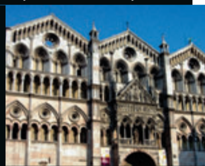
De kathedraal toont alle historische periodes die de stad doormaakte.