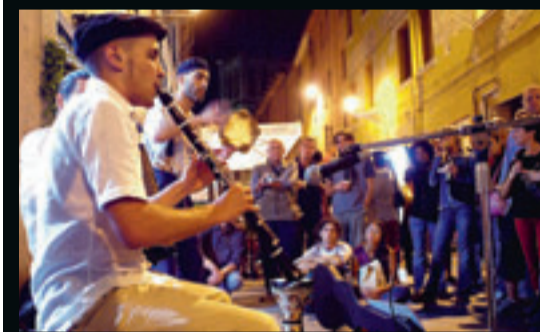
Het Buskers Festival brengt straatkunstenaars uit de hele wereld bijeen.