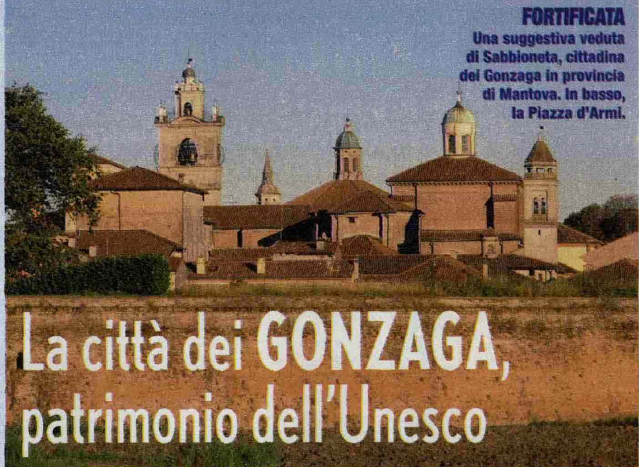
FORTIFICATA Una suggestiva veduta di Sabbioneta, cittadina dei Gonzaga in provincia di Mantova. In basso, la Piazza d'Armi.