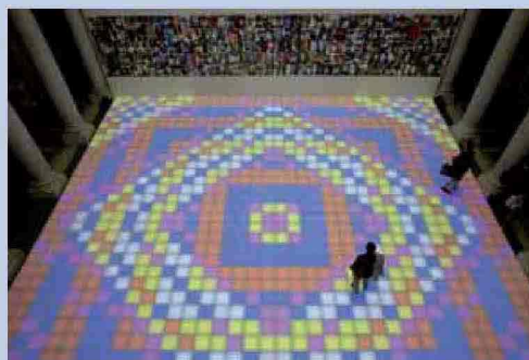
Piotr Uklanski, Untitled (Dancing Nazis)

Articolata fra la 'storica' sede di Palazzo Grassi e gli spazi di Punta della Dogana tra il Canal della Dogana Mapping the Studio costituisce un'ulteriore scommessa da parte di François Pinault che non solo apre alla sua immensa collezione privata, ma anche al processo formativo della stessa, accompagnando la dinamica creativa degli artisti. Grandiosi i vari ambienti tra cui Room 1-a con opere di Felix Gonzales-Torres , Rachel Whiteread , Maurizio Cattelan con il suo Cavallo impagliato , Richard Prince e Luc Tuymans con l'imponente e raffinatissimo olio Untitled (Still Life) . Impossibile perdere il Ragazzo con la rana , scultura posta scenografica-