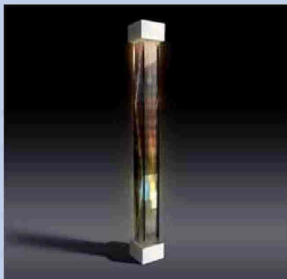
Gianni Colombo, Cromostruttura

ra artistica che diventa tale grazie alla partecipazione dello spettatore che ne attiva i meccanismi cinetici. Ed è veramente un piacere oltretutto un divertimento anche per chi non è molto sensibile all'arte contemporanea osservare con ammirazione il centinaio di opere-chiave della sua produzione - tra sculture mobili, quadri, strutture di luce e alcuni tra i suoi ambienti più singolari - presenti in mostra e attraverso le quali emergono straordinarie capacità intuitive e intellettive e un senso di chiaro equilibrio razionale e quindi di serenità diffusa.