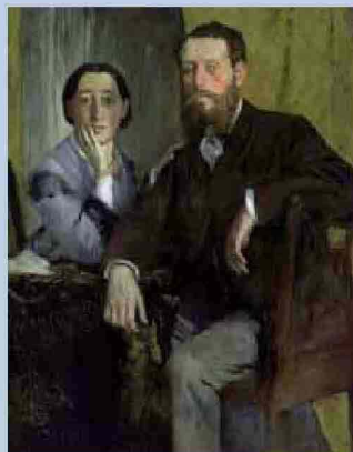
Edgar Degas, Edmondo e Thérèse Morbilli

La splendida mostra esposta nelle suggestive sale di Castel Sismondo a Rimini vuol essere una grande lezione di storia dell'arte raccontata a tutti. Questo perché i 65 capolavori esposti, provenienti da uno dei maggiori musei del mondo, il Museum of Fine Arts di Boston, arrivano direttamente allo spettatore, coinvolgendolo anche se non ha compiuto studi specifici. Ritratti, nature morte,