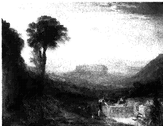
Joseph Mallord William Turner, Veduta di Orvieto

nel 1802 giunge per la prima volta ad Aosta. Il racconto della fatica e dello sbigottimento di piccoli uomini accompagnati da animali con le somme, quasi inghiottiti dallo scenario sublime dei monti, fluisce morbido come un fiume di parole in Passo del San Gottardo dal centro del ponte del Diavolo . Altrettanto affascinanti le varie rappresentazioni di Roma, in equilibrio tra l'antico e il moderno, dove copia le sculture romane e avverte il fascino degli antichi miti come Il lago d'Averno. Enea e la Sibilla Cumana dove la natura è adamantina mentre diventa incantata nella Veduta di Orvieto , e quelle di Venezia la cui aura di decadenza intrisa di indolente lusso è resa con nuova libertà espressiva raggiungendo soluzioni formali audaci.