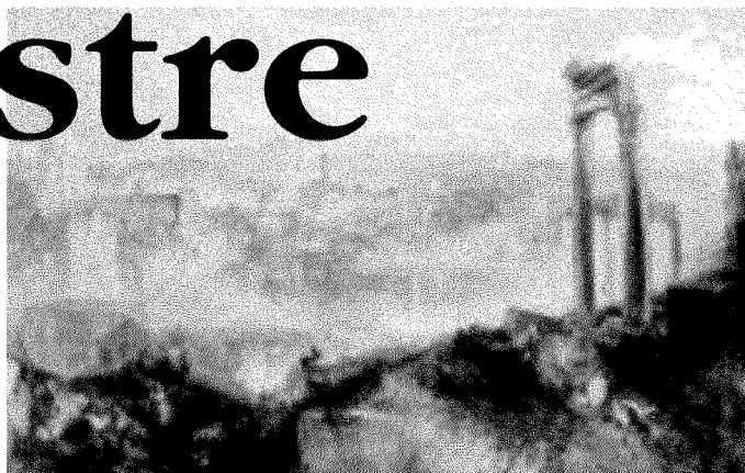
«Roma moderna Campo Vaccino» (1839) Sotto, «Arrivo a Venezia» (1844) due dipinti di Turner esposti a palazzo dei Diamanti di Ferrara

La mostra ferrarese va in un crescendo con opere sensazionali, e culmina nelle riprese di Venezia - dove Turner ricompiere il Grand Tour del 1840 - che segnano la svolta definitiva del suo stile: in «Arcora non aveva visto dal vero a Venezia», le forme si dissolvono in dorate suggestioni bizantine di una pittura visionaria, mentre in altre scene veneziane la città, che pare svanire nella bruma, diventa opera astratta, intessuta di sentimento e di pura energia di colori-luce; è un tuffo senza ritorno nel futuro, verso Claude Monet, vero l'astrattismo. Un genio, celebrato in patria (che ha lasciato erede di oltre 16.000 lavori) con l'onore della sepoltura nel 1851 nella cattedrale di Saint Paul.