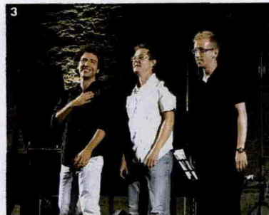
Ritaglio stampa ad uso esclusivo del destinatario, non riproducibile.