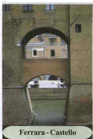
Ferrara - Castello