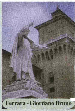
Ferrara - Giordano Bruno