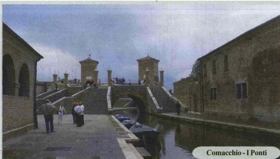
Comacchio - I Ponti