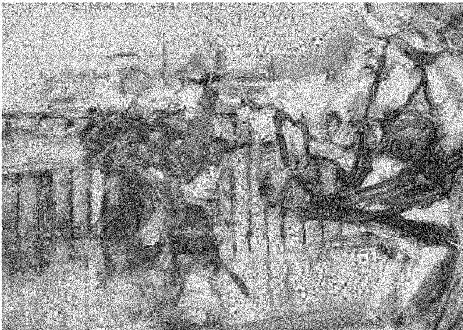
Le pont des Saints-Pères, 1881-1886 ca.