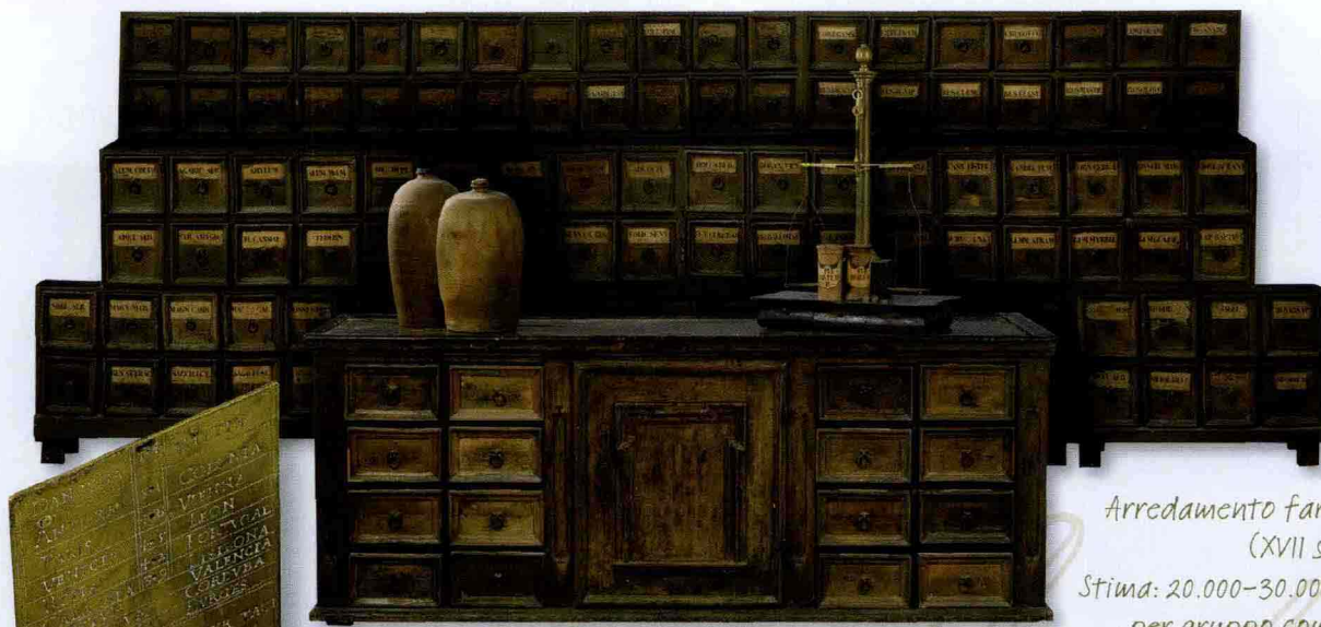
Arredamento farmacia (XVII secolo) Stima: 20.000-30.000 Euro per gruppo completo