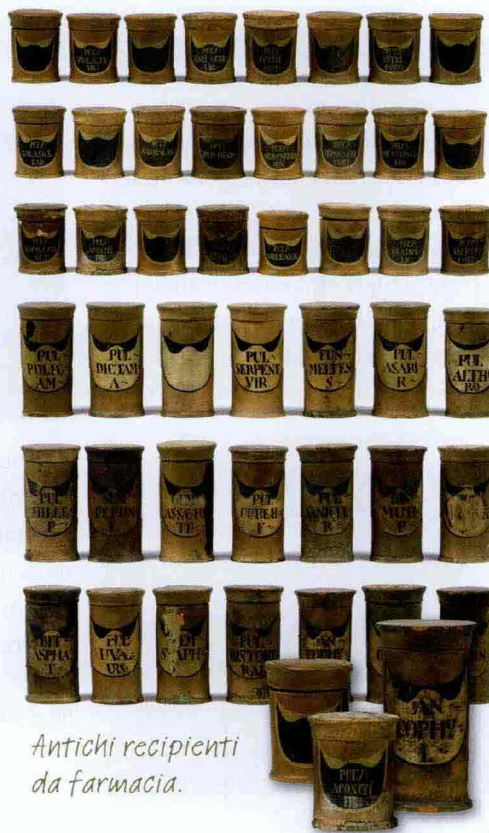
Antichi recipienti da farmacia.

quindi qualche piccola anticipazione su quelli che saranno i protagonisti della vendita, che saranno in esposizione il prossimo 13 ottobre. Tra questi il più importante sarà forse un raro banco da farmacia del XVII secolo di qualità museale proveniente da un negozio a Schärding am Inn. Il lotto si compone di tre alzate provviste di cassettoni, un banco di vendita, mortaio, bilancia e tanti affascinanti recipienti e scatole da farmacia. Altro pezzo interessante è l'orologio solare di Georg Hartmann (1489-1564), rinomato artigiano di Norimberga amico di Albrecht Dürer. Non mancheranno poi, oltre ai globi scientifici e ai microscopi di manifattura inglese, macchine fotografiche d'epoca e accessori risalenti al periodo compreso tra il 1860 e il 1950.