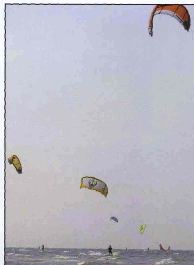
Un gruppo di appassionati di kitesurf, soltanto una tra le tante attività sportive che è possibile praticare sul mare della costa adriatica

Da una parte c'è l'Emilia, ricca di arte e testimonianze medievali, baluardo di tipicità e tradizioni alimentari; dall'altra la Romagna, con la sua godereccia Riviera, regno del divertimento, ricca di spiagge attrezzate, discoteche, parchi tematici, ma anche di rocche e castelli. Insieme offrono agli eventi location originali e ambientazioni d'atmosfera