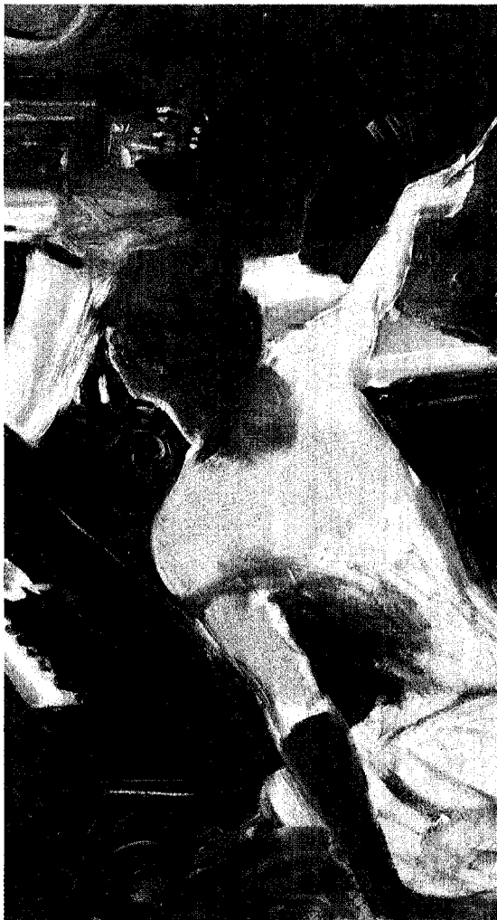
Natura e società. Due dei dipinti realizzati da Giovanni Boldini durante il soggiorno francese: in alto «La cantante mondana», 1884, Collezione Carife; a sinistra, «La grande strada di Combes-la-Ville», 1873, Philadelphia Museum of Art