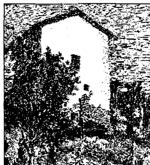
"Zinnie in un vaso", 1932 A destra: "Paesaggio (Casa a Grizzana), 1927 Foto grande in alto: "Natura morta con nove oggetti", 1954