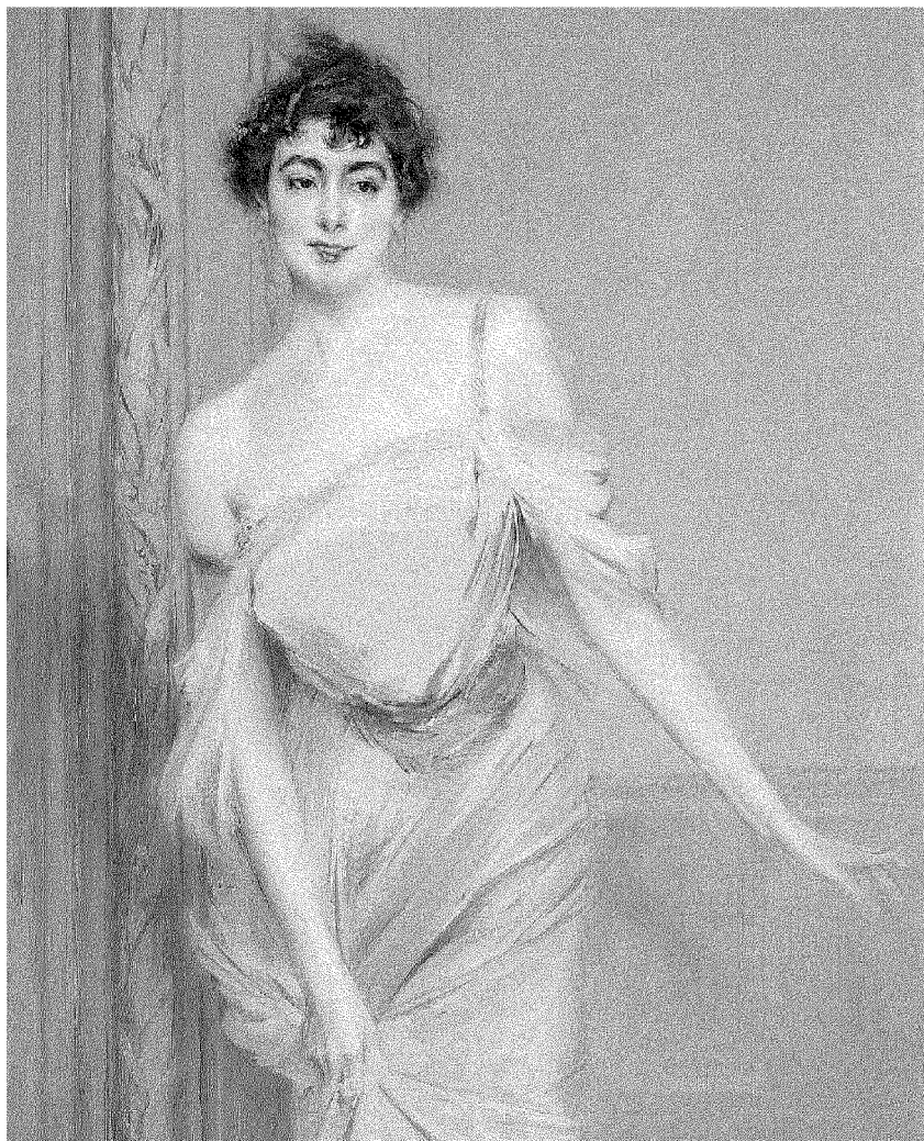
Boldini, "Ritratto di Madame Charles Max", 1901, uno dei ritratti più belli e celebri