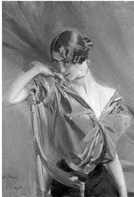
"Cléo de Mérode", olio su tela, 1901