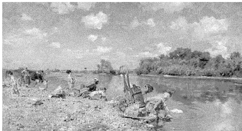
Il classicheggiante "L'amazzone (Alice Regnault a cavallo)", olio su tavola, 1879-80, e lo strepitoso "Le lavandaie", olio su tela, 1874