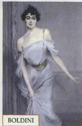
GIOVANNI BOLDINI. RITRATTO DI MADAME CHARLES MAX, 1898