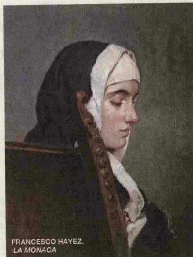
LA MONACA DI MONZA