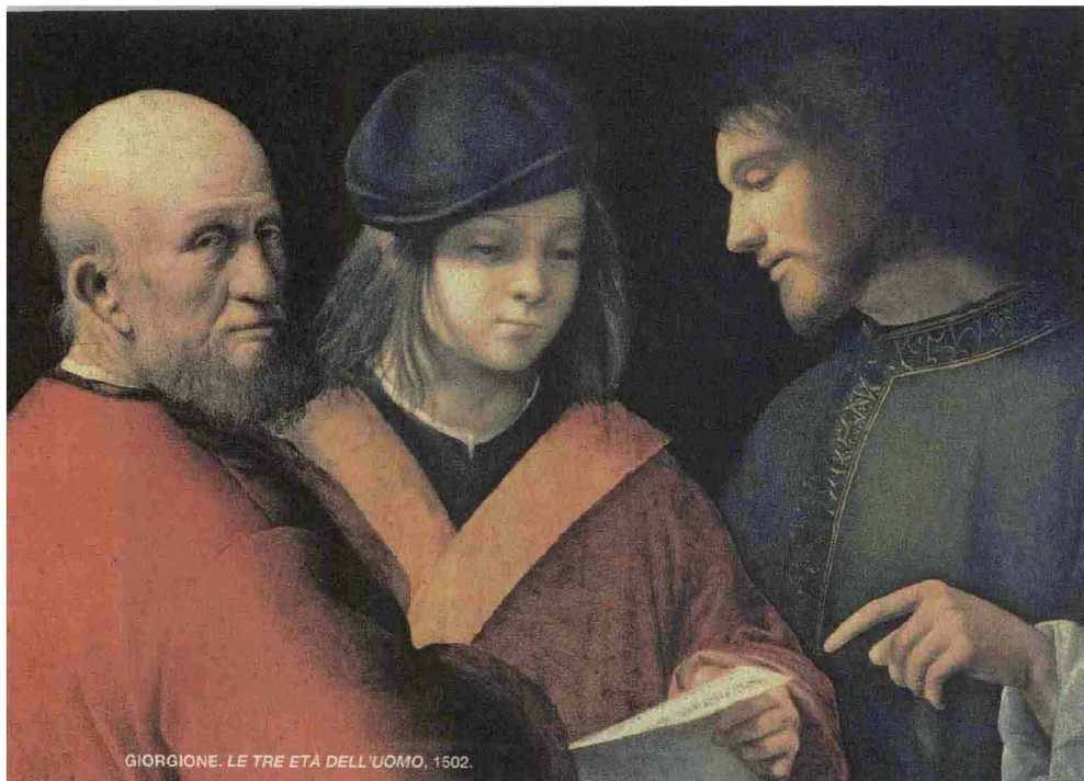
GIORGIONE. LE TRE ETÀ DELL'UOMO, 1502.