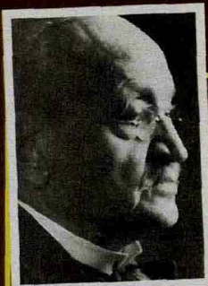
Il celebre pittore Giovanni Boldini (1842-1931).

Giovanni Boldini: due mostre a Roma e a Ferrara e la sua storia