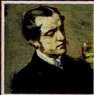
Ferrara. Questo è un particolare del quadro di Boldini intitolato "Autoritratto mentre osserva un dipinto", in mostra a Ferrara.

quando concentrò la sua produzione artistica quasi esclusivamente sui ritratti femminili, come se avesse voluto compensare la propria bruttezza dipingendo soltanto la bellezza. Donne esili, sofisticate, ambiziose, agghindate in abiti di seta e con lunghi guanti di raso, sedute su divani stile Impero, nude sul letto o in piedi per evidenziare lo striminzito girovita. Donne che lui sapeva trasformare in figure leggiadre, esaltandone la bellezza con il cosiddetto "effetto fuoco d'artificio", cioè con pennellate di bianco o di nero lucente simili a sciaolate di luce per ricreare sulla tela l'idea del turbino del vento. Una tecnica pittorica che lo rese unico nel panorama artistico mondiale e che caratterizzò tanti suoi capolavori, da Ritratto di donna Franca Florio a Ritratto di madame Marie-Louise Herouet , da Giovane bruna a letto a Ritratto della marchesa Casati , molti dei quali esposti anche nelle due mostre di Ferrara e di Roma.