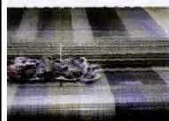
L. Robin, "Lanificio Barbera", Callabiana, da "Metamorfosi. Immagini sulla strada della lana", a Moncalieri.