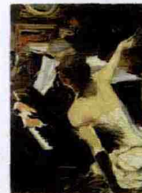
Giovanni Boldini, "La cantante mondana", 1884, Collezione Fondazione Carife.

Ferrara dedica a Giovanni Boldini un'esposizione che si concentra sui primi quindici anni di attività del pittore a Parigi, dal 1871 al 1886, con l'intento di fare luce su un periodo della sua arte poco studiato. A Palazzo dei Diamanti vengono presentati 90 capolavori ordinati in sezioni tematiche: una serie di vedute di città, nelle quali l'artista registra la vita che scorre nelle vie affollate dove passano veloci carrozze e omnibus; paesaggi di campagna; il mondo dei teatri e dei caffè; gli interni di atelier e il genere del ritratto, dove Boldini porta un'autentica rivoluzione, ponendo i suoi modelli in situazioni informali. Fino al 10 gennaio 2010. Tel. 0532/244949.