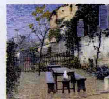
Telemaco Signorini, "Mattino di settembre a Settignano", 1892, olio su tela (Galleria d'Arte Moderna di Firenze).

Palazzo Zabarella, a Padova, ospita l'importante mostra, la più completa che sia mai stata fatta, dedicata all'artista toscano, conosciuto a livello internazionale. I suoi massimi capolavori sono messi a confronto con quelli di altri grandi maestri della pittura europea negli ultimi decenni dell'800: Degas a Tissot, Decamps, Corot, Courbet, Rousseau, Sisley e altri. Il confronto è mirato su assonanza di temi e di tempi, situazione su situazione, soggetto su soggetto sempre con precisione. L'esposizione resta aperta al pubblico fino al 31 gennaio 2010. Tel. 049/8753100.