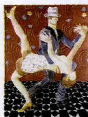
Franco Gentilini, "Il tango", 1973, olio su tela sabbata, esposto a Milano.