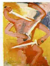
K.H. Hodicke, "Danza con spade", 1985, acrilico su tela, per la mostra "Gli anni '80" di Monza.