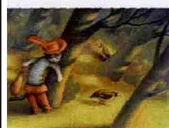
Illustrazione di Paolo Domeniconi, 2009, acquerello su carta, a Rovigo.