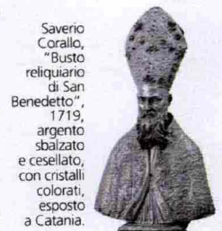
Saverio Corallo, "Busto reliquario di San Benedetto", 1719, argento sbalzato e cesellato, con cristalli colorati, esposto a Catania.