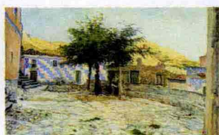
Telemaco Signorini, "Poggio all'isola d'Elba", 1888, olio su tela (Galleria d'Arte Moderna Carlo Rizzardo di Feltre).

Palazzo Zabarella, a Padova, ospita l'importante mostra, la più completa che sia mai stata fatta, dedicata all'artista toscano, conosciuto a livello internazionale. I suoi massimi capolavori sono messi a confronto con quelli di altri grandi maestri della pittura europea negli ultimi decenni dell'800: Degas a Tissot, Decamps, Corot, Courbet, Rousseau, Sisley e altri. Il confronto è mirato su assonanza di temi e di tempi, situazione su situazione, soggetto su soggetto sempre con precisione. L'esposizione resta aperta al pubblico fino al 31 gennaio 2010. Tel. 049/8753100.