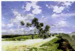
Giovanni Boldini, "La grande strada a Combes-la-Ville, 1873, Philadelphia Museum of Art.

Ferrara dedica a Giovanni Boldini un'esposizione che si concentra sui primi quindici anni di attività del pittore a Parigi, dal 1871 al 1886, con l'intento di fare luce su un periodo della sua arte poco studiato. A Palazzo dei Diamanti vengono presentati 90 capolavori ordinati in sezioni tematiche: una serie di vedute di città, nelle quali l'artista registra la vita che scorre nelle vie affollate dove passano veloci carrozze e omnibus; paesaggi di campagna; il mondo dei teatri e dei caffè; gli interni di atelier e il genere del ritratto, dove Boldini porta un'autentica rivoluzione, ponendo i suoi modelli in situazioni informali. Fino al 10 gennaio 2010. Tel. 0532/244949.