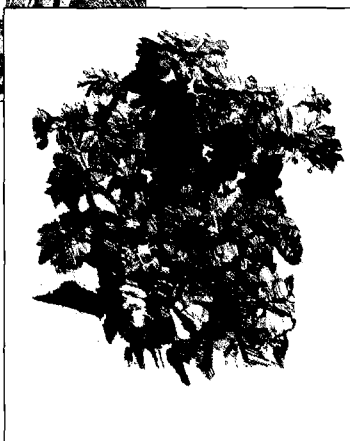
Giorgio Morandi: Gruppo di zinnie, 1931, Acquaforte, mm 227x191 Bologna, Museo Morandi