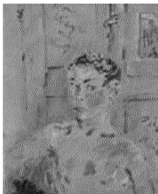
Ritratto di Allegro (1940)

Una piccola ma preziosa mostra, che espone l'eccellenza delle opere dell'ultimo periodo di de Pisis, quello meno indagato. Si inaugura oggi al Museo Morandi ed è frutto della collaborazione tra Mambo e le istituzioni d'arte di Ferrara, che si scambiano anche agevolazioni per i visitatori. Cofferati: «Finalmente prende il via la sinergia fra le due città».