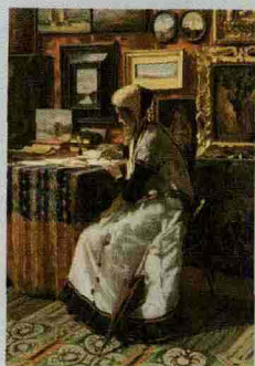
Telemaco Signorini: Non potendo aspettare

19 A Palazzo Zabarella, fino al 31 gennaio, cento opere di altissima qualità provenienti dal museo d'Orsay di Parigi, dall'Ermitage di San Pietroburgo e da altri importantissimi musei italiani e internazionali, mettono a fuoco la personalità di Telemaco Signorini che, sotto