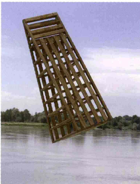
6. Simone Tosca, Studio per Niente , 2009; 7. Riccardo Benassi, Autostrada Verticale , studio per Scala, 2009