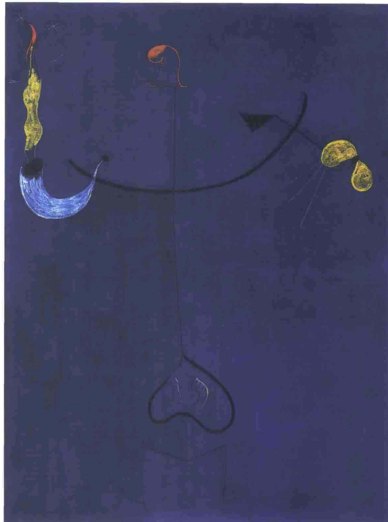
Joan Miró, Paesaggio catalano con chitarra , 1924

Enigmi metafisici che scivolano via dai silenzi, dalle solitudini malinconiche inaugurate dai simbolismi di fine Ottocento ed approdate nel XX secolo dietro le tende scure degli oracoli dechirichiani. Ma già negli anni '70 Bernard Faucon, un vero maestro della fotografia europea, anticipa tutto e tutti: gli enigmi diventano di gruppo, appartengono a schiere di "mannequins" adolescenti che si sporgono dall'alto di un universo quotidiano che più non sembra appartenere allo spirito. I giovani di Bernard Faucon, in mostra alla Galleria "Paci Arte" di Brescia (fino al 19 aprile), hanno occhi tondi e sbarrati, fotograficamente ritagliati in volti anonimi e tuttavia ribelli. Perciò la sua è quasi una fantascienza del quotidiano, se quotidiano è il rito di riunirsi, di tenersi stretti gli uni agli altri, eppure gli uni agli altri assolutamente estranei, nella lontananza di un dialogo o comunque di una parola assente. E' questa la metafisica fantascientifica