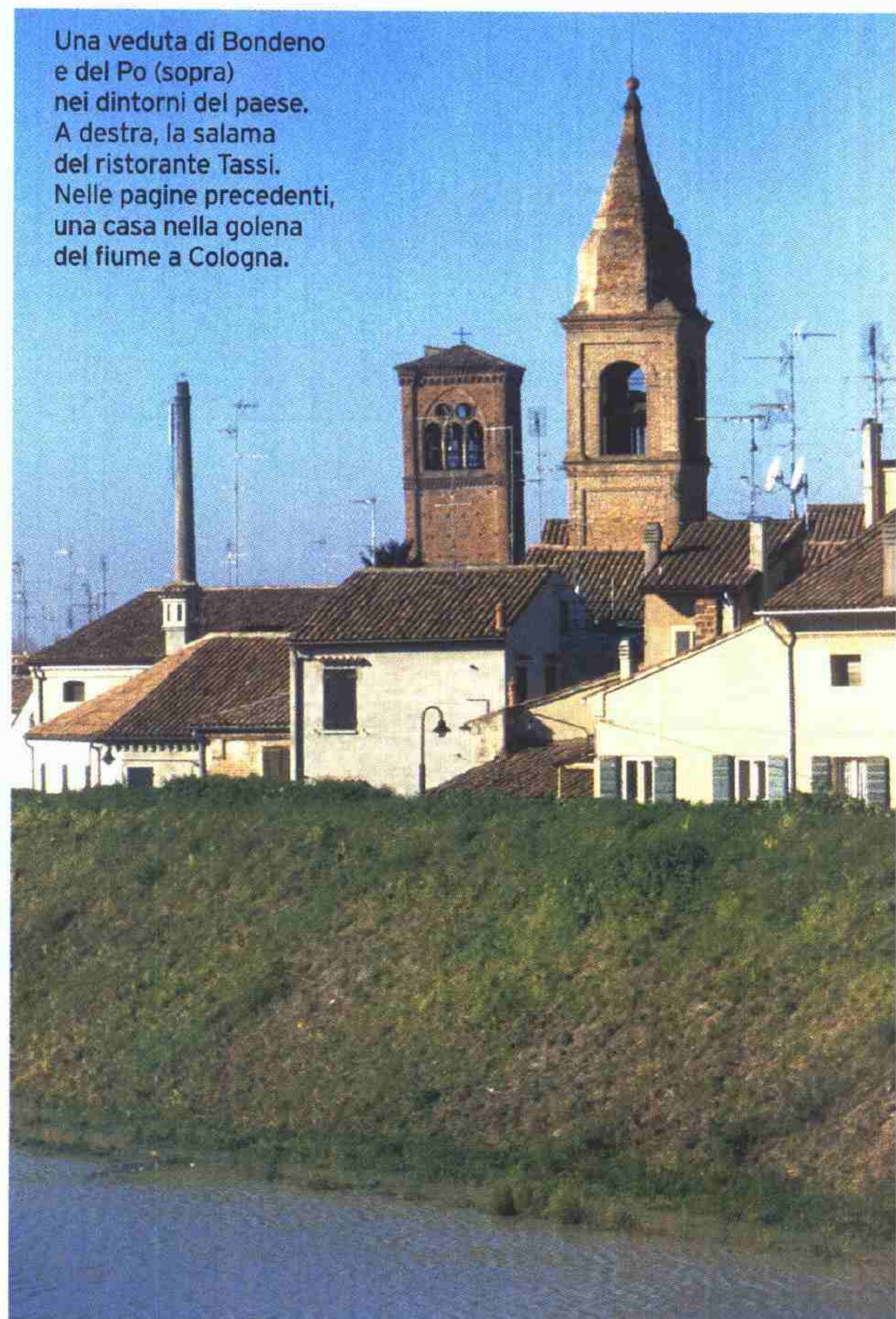
Una veduta di Bondeno e del Po (sopra) nei dintorni del paese. A destra, la salama del ristorante Tassi. Nelle pagine precedenti, una casa nella golena del fiume a Cologna.

IL TEMPO SI È FERMATO A BONDENO. Poca apparenza, molta sostanza, da queste parti. Più trattori che tir sulle strade. Terra grassa, fertile, ben coltivata di frutta e seminativi, dove la gastronomia non è quella modaiola da salotto ma cultura, anima. Salumi, pasta, il famoso pane ferrarese a crocetta (la "coppia ferrarese"), e soprattutto "Lei", la salama da sugo . E un grande come Mario Soldati, in tempi non sospetti - cinquant'anni fa - non poteva non cogliere le sfumature di questo centro ideale della Pianura Padana, all' incrocio di quattro province (Modena, Ferrara, Mantova, Rovigo) e tre regioni : lo fece "cantando" proprio la salama durante " Viaggio lungo la valle del Po alla ricerca dei cibi genuini ", del 1957, "madre" di tutti i programmi televisivi da allora dedicati all'enogastronomia. L'Alto Ferrarese, apparentemente "brutto" e piatto, è infat-